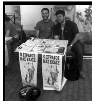
Ο Σύνδεσμος Αντιρρησιών Συνείδησης στο Schoolwave! 23-25 Ιούνη - Τεχνόπολις