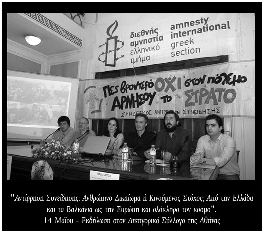
"Αντίρρηση Συνείδησης: Ανθρώπινο Δικαίωμα ή Κινούμενος Στόχος; Από την Ελλάδα και τα Βαλκάνια ως την Ευρώπη και ολόκληρο τον κόσμο". 14 Μαΐου - Εκδήλωση στον Δικηγορικό Σύλλογο της Αθήνας

Πληροφορίες: www.wri-irg.org/news/2007/council2007-en.htm , www.antirrisies.gr/?q=node/265 και στο τηλέφωνο του Συνδέσμου.